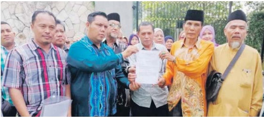
Antara peniaga yang menyerahkan memorandum di Istana Alam Shah, Isnin lalu.

PANDAN INDAH -Majlis Perbandaran Ampang Jaya (MPAJ) menerima aduan daripada penduduk di sekitar kawasan gerai Tasik Tambahan yang mendakwa premis tersebut dikendalikan warga asing.