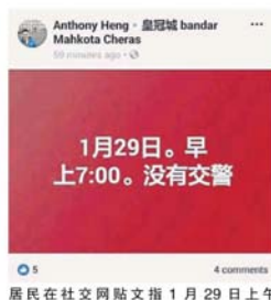
居民在社交网贴文指 1 月 29 日上午时段没有交警驻守。

当天的会议也提出雇用志愿警卫人员到该路驻守，但因为权限问题，不能这样做。此外，也有建议在早上时段辟出驶车道，因安全问题，同样不能这样做。