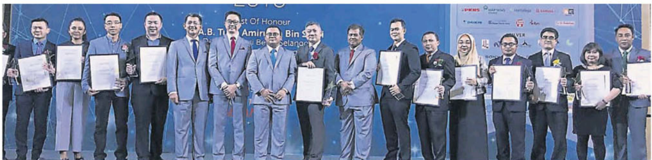
雪兰莪投资促进机构与雪州投资休闲俱乐部联办“2018 雪州投资奖”, 颁发 18 奖项给投资雪州表现最佳的公司与单位。

“这 5 大核心领域将成为加速雪州成长与发展的重点, 为了有效的推广次领域发展, 州政府也特别成立雪州生物科技、雪州航空理事会、雪州清工业以及电子商务理事会。”