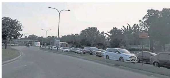
皇冠城往隆市方向的车道堵塞，与反方向车道形成强烈对比。

去了哪。负责该区事务的市议员，是于去年 12 月在网贴文指交警会在该路口指挥交通，居民听后开心不已，相信交警指挥交通后可缓和交通堵塞问题，不料好景不长，开心的日子瞬间消失。