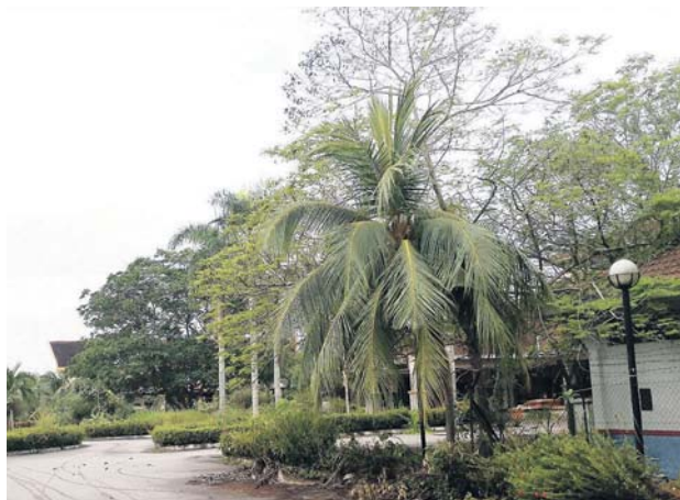
Resort milik kerajaan yang terbiar kira-kira setahun lalu.