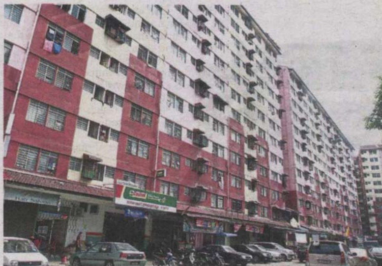
Desa Mentari has been identified as one of the 18 dengue hotspots in Petaling Jaya.

announced that it has opened applications for resident groups to apply for a RM6,000 allocation under the Pasukan Keselamatan Kejiranan Petaling Jaya (PKKPJ) programme.