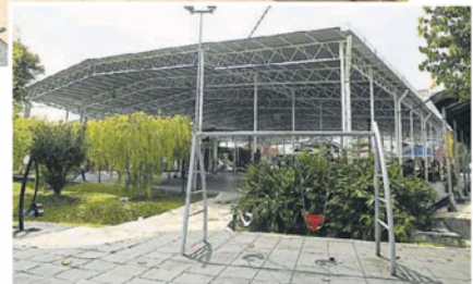
获提升的篮球场，之后会成为当地的活动中心。