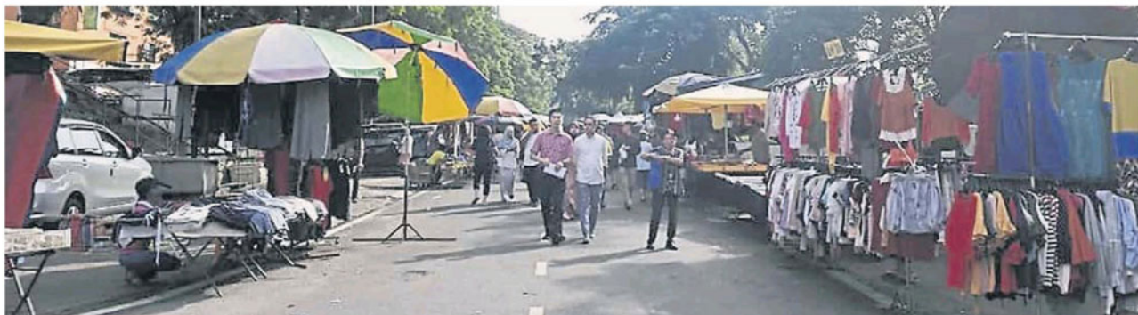
双溪龙早市小贩将在原地摆卖至另行通知。