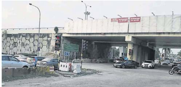
记者于 1 月 25 日上午 8 时到皇冠城主要通道路口巡视，没看到交警的踪影。

只是指挥 20 分钟后就离开，据记者观察及民众回馈，截至昨天 (29 日)，问题仍未解决，结果引来居民抨击，并在社交网贴文指上午 7 时也未见交警在路口指挥交通。