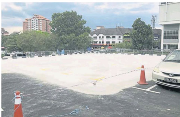
早市摆卖新地点部分地段铺上洋灰, 居民指另有乾坤。