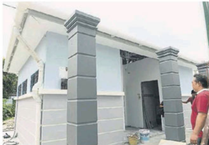
被拆掉重建的公厕，将设有无障碍设施。