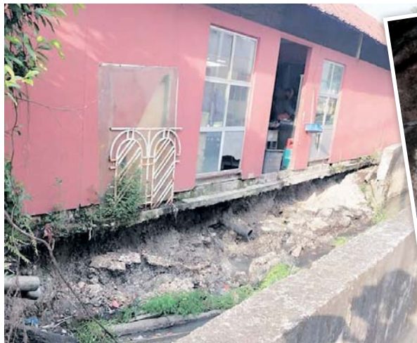
Struktur bangunan Gerai Makan Jalan Puding condong disebabkan mendapan yang berlaku semakin serius.

"Risau sangat sebab bila-bila masa saja gerai ini boleh roboh. Harap sangat pihak berkenaan segera selesaikan masalah ini," katanya.