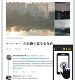
Ciapan di Twitter seorang penduduk pada 19 Februari lalu berhubung kejadian, sebelum mendapat respon Amirudin keesokan harinya.