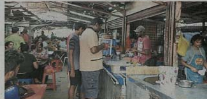
如今印裔是巴刹里最多的经营者族群，这里因此有三大民族的产品可供选。