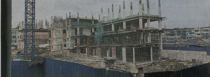
高处眺望，原本 6 层楼设计的新巴刹，目前只完成其中 3 层楼的部分架构而已。

莎阿南市政厅公关沙林受询时也指出，市政厅将按关键绩效指标 (KPI) 行事，承包商若没按规时段完成工程建设，将被撤换及罚款。