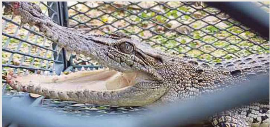
ANAK buaya masuk ke dalam perangkap selepas lima hari operasi dijalankan.