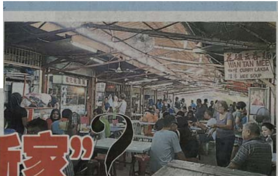
食肆档口是不少居民购买早餐和喝下午茶的好地方。