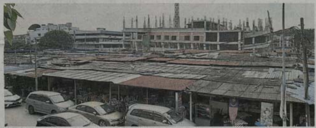
虽然与钢筋水泥城市有点格格不入，但莎阿南太子园巴刹木制建筑已成为城中一大特色。

“我们也希望当局能关注本区环境卫生问题，尤其应取地外劳高空垃圾问题，因为这已严重影响附近环境卫生清洁问题，进而导致消费者为之却步。”