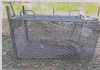
INILAH anak buaya tembaga yang dilepaskan oleh individu tidak bertanggungjawab ke Tasik Shah Alam dan berjaya ditangkap selepas masuk perangkap yang diisi dengan umpan ayam semalam.

“Sebanyak tiga perangkap saiz sederhana, dua jala dan satu pukot telah