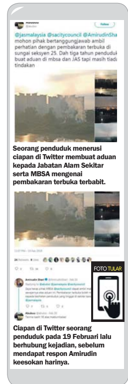
Seorang penduduk menerusi ciapan di Twitter membuat aduan kepada Jabatan Alam Sekitar serta MBSA mengenai pembakaran terbuka terbit.

Sharin juga memberitahu, tindakan membuat halangan tersebut dijalankan MBSA minggu lalu.