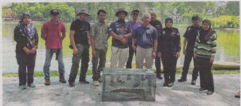
ANAK buaya yang dilihat di Taman Tasik Shah Alam pada Jumaat lalu berjaya ditangkap selepas memasuki perangkap dipasang Perhilitan Selangor semalam.

"Pihak MBSA dengan ini ingin mengucapkan terima kasih kepada semua pihak khususnya Perhilitan, Jabatan Bomba dan Penyelamat Malaysia (JBPM) Shah Alam serta Renjer Taman MBSA," katanya.