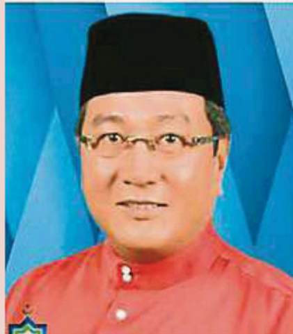
雪州宗教局局长拿督哈利斯卡欣将走马上任为沙亚南市长。