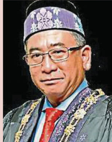
八打灵再也市长拿督阿兹兹将被调任为雪州发展机构总经理。