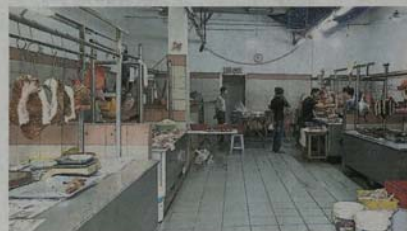
附近私人经营的巴刹，其猪肉档口卫生环境清洁，也成为旧巴刹激烈竞争对手之一。

原以为 2014 年宣布工程投入运作后，事件便可告一段落，岂料封尘“史”记仍未完结，万命的莎阿南太子园巴刹小贩，至今终究还是盼不到“新家”。