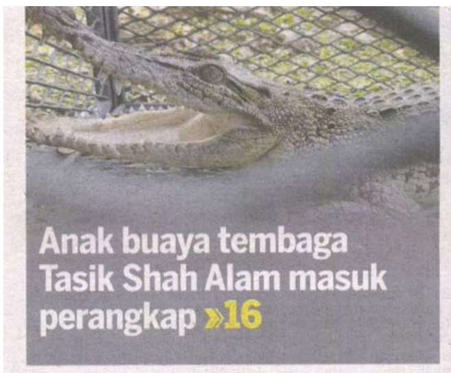
Anak buaya tembaga Tasik Shah Alam masuk perangkap »16

Reptilia sepanjang satu meter itu ditempatkan di Paya Indah Wetland, Banting