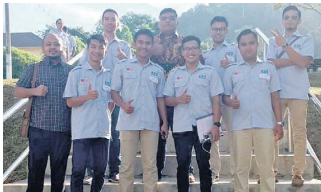
Ahli Jawatankuasa AMK Cabang Hulu Selangor yang menyertai program latihan.

"Sehubungan itu, ahli mengikuti program Pelatihan Angkatan Muda Keadilan bagi Angkatan Pertama di Kem Ghafar Baba, Kemensah baru-baru ini bagi tujuan ter-