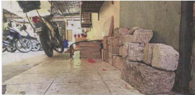
Residents have resorted to placing makeshift barriers to stop rodents from entering their homes. Problems faced by the residents include maintenance wiring, and broken amenities.