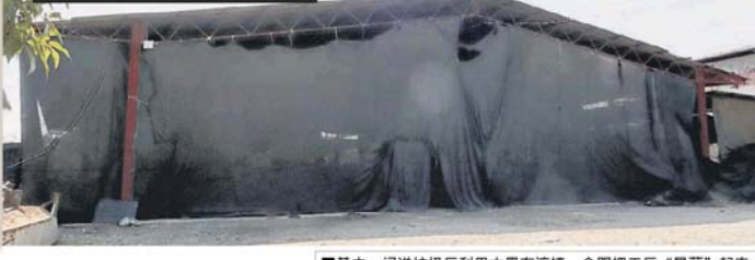
■其中一間洋垃圾廠利用大黑布遮掩，企圖把工廠“屏蔽”起來。