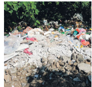
Sampah sarap yang dibuang oleh pihak tidak bertanggung jawab.

"Rumah tidak berpenghuni ini ada di antaranya sudah terbiar sejak lebih 10 tahun yang lalu ianya berpotensi menjadi lokasi pembiakan nyamuk dan binatang berbisa," katanya.