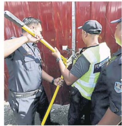
执法人员以大剪刀剪开锁头。