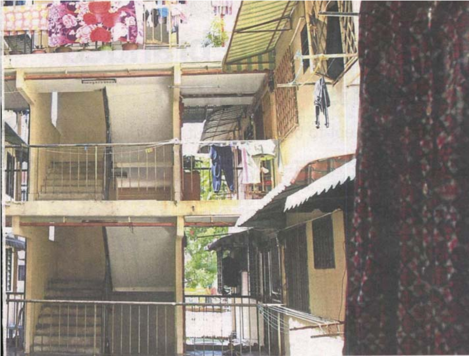
The Taman Pandan Jaya low-cost flats are falling into disrepair as many of the residents cannot afford to pay for maintenance.