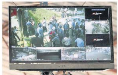
■閉路電視對工廠大門外的動靜了如指掌，執法人員進入工廠時，員工早已逃之夭夭。