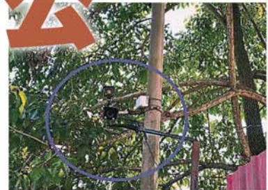
业者在大门外装闭路电视器以监视周边环境。