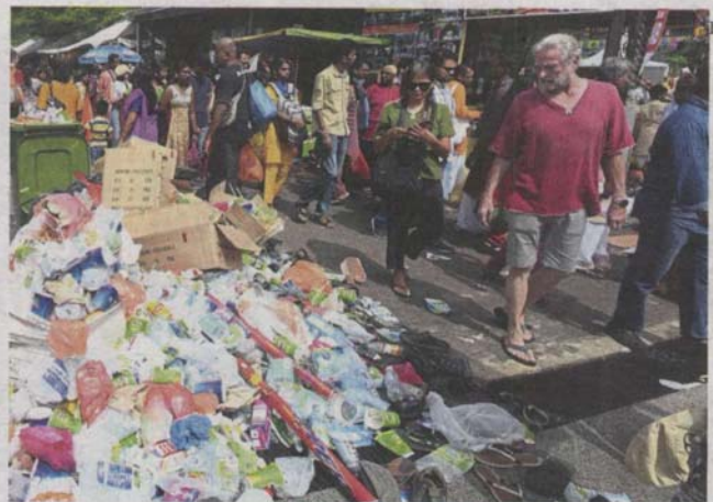
Mounds of rubbish left in the aftermath of Thaipusam.

"Our council workers are experienced in doing this job, as it is an annual celebration.