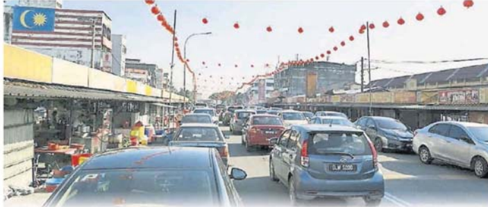
本地人和游客首选的用餐地点。大街的美食街将打造成“美食街”，让大街成为