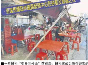
一旦班村“变身三部曲”落成后，班村将成为吸引游客的景点，让大家可以有更舒适的用餐环境。