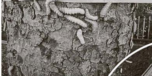
沙亚南市政厅接获民众投报后,已前往出现毛毛虫地点视察情况,并在树身拉起警戒线,避免任何人趋近和碰触毛毛虫。

“有些毛毛虫是掉落在地上,有些则是散落在沟渠四周,但它们不长毛,也不会危害民众的安危,他们无需因此而感到恐慌,虽然有关树木距离住宅区有大约50公尺,但毛毛虫却没有潜入住家范围。”