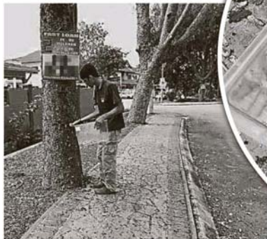
国家动物园的职员正在采集毛毛虫的样本。