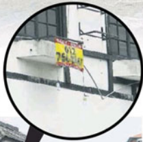
■双溪龙商业中心许多商店楼上被改造成学生宿舍。小图为一些商店楼上单位仍在寻找租户。

房，让30多位学生居住。 她指出，单人房房租介于300令吉至400令吉，租金也不便宜，但市议会关注的是安全问题。 她说，市议会城市规划组正在草拟条例，包括提供宿舍指南，日后会规定业者必须申请执照。 “这项草案在准备中，但基于有过多繁文缛节，市议会还需要再研究，以便简化申请。” 她指出，除了学生宿舍，也有业主出租单位给商家作为员工宿舍；在万宜新镇，一些宗教学校也租用楼上单位作为学生宿舍，这些都必须要受到管制。