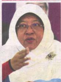
Haniza says the programme will allow urban areas to accommodate more new and affordable housing.