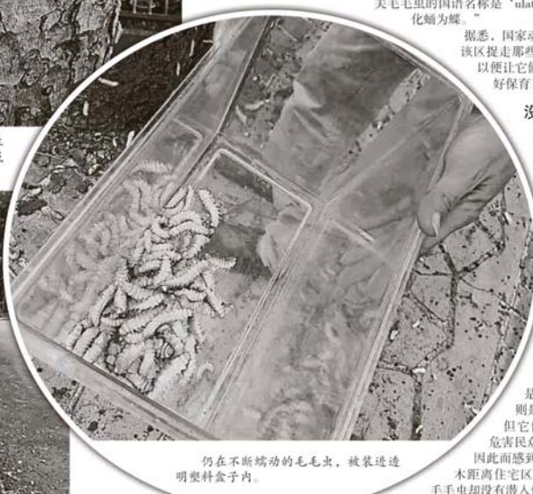
仍在不断蠕动的毛毛虫,被装进透明塑料盒子内。