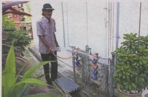
George is concerned about the time it would take for the residents to get the new units.