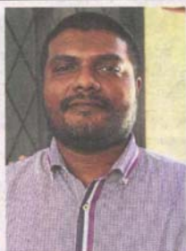
Harii says the proposal sounds too good to be true.