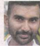
S. MANNI Kepong

"ISU-ISU di kawasan sambutan Thaipusam ini bukan sesuatu yang baharu sebaliknya berlaku setiap tahun. Cuma orang ramai perlu ada sikap tanggungjawab untuk sama-sama jaga kebersihan."