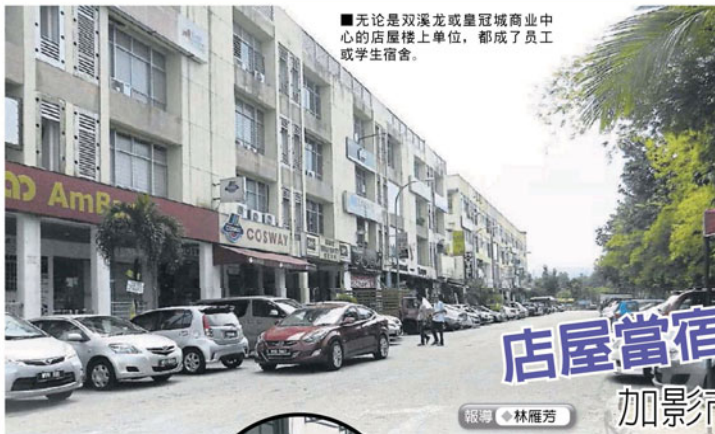
■无论是双溪龙或皇冠城商业中心的店屋楼上单位，都成了员工或学生宿舍。

Provided for client's internal research purposes only. May not be further copied, distributed, sold or published in any form without the prior consent of the copyright owner.