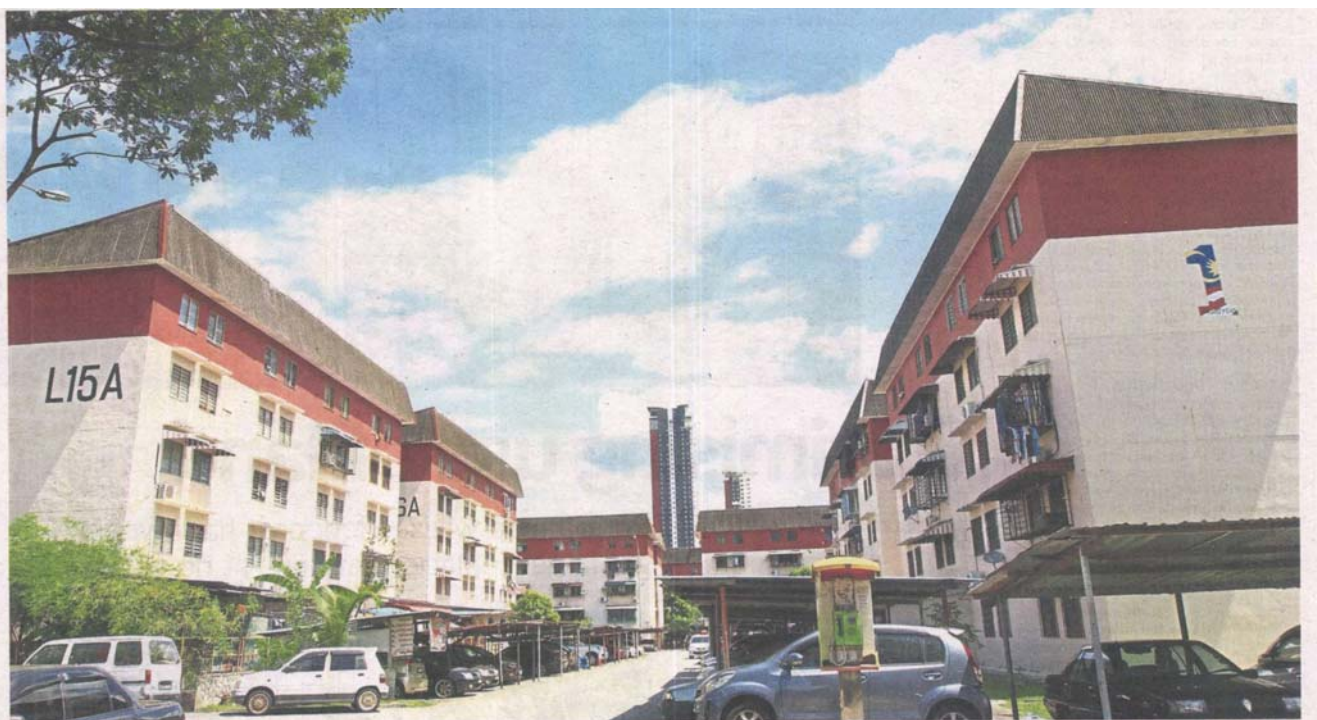
Better future: Taman Pandan Jaya residents in Ampang could have the option of moving into bigger units with the tentative proposal to redevelop the area.