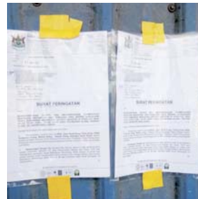
Notis yang ditampal dihadapan premis.