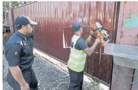
■電動鋸，把大門鑄板鎖開。閉路電視對工廠大門外的動靜了如指掌，執法人員進入工廠時，員工早已逃之夭夭。