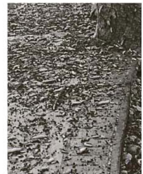
逃地的毛毛虫,有的已经死亡,有的仍存活,据说它们是化蛹成蝶的毛毛虫。