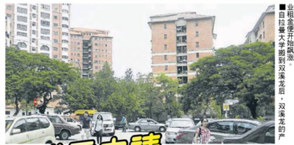
■业租金便开始飙升。 ■自拉曼大学搬到双溪龙后，双溪龙的产