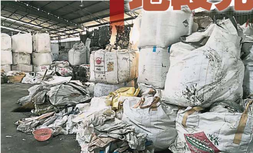
洋垃圾厂内囤积大量进口洋垃圾，数量惊人！