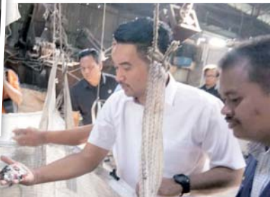
Azmizam menunjukkan sisa plastik yang belum diproses.

belum melakukan kerja-kerja pembersihan dan pemulihan semula tanah.