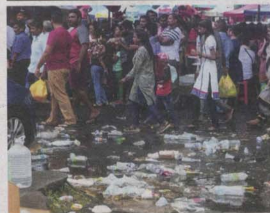
SAMPAH-SARAP yang dibuang oleh pengunjung Kuil Sri Subramaniam.

Oleh NIK HAFIZUL BAHARUDDIN pengarang@utusan.com.my