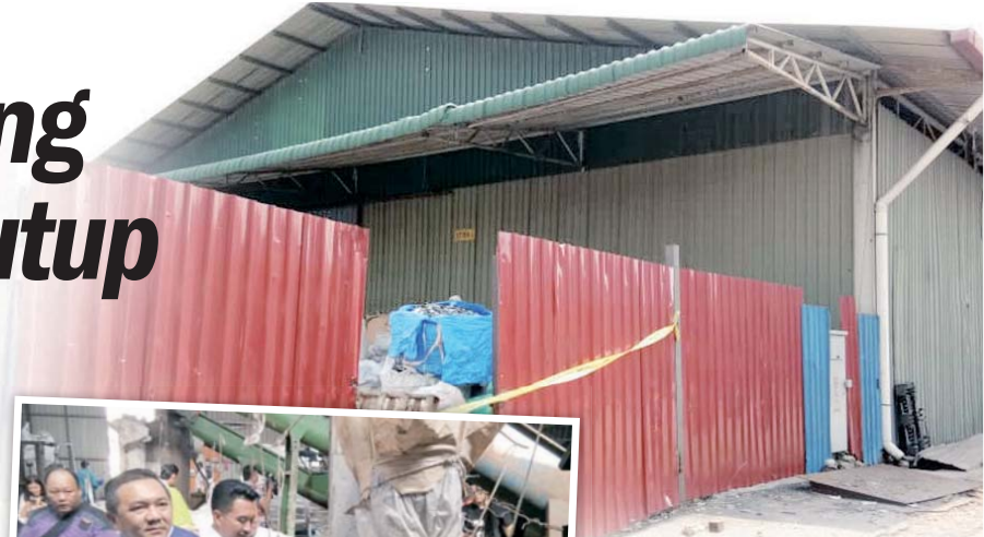
Kilang haram yang disita dalam operasi bersepadu, semalam.

"Melalui pemantauan yang dijalankan, terdapat dua lagi tapak kilang yang sebelum ini dikenakan tindakan masih