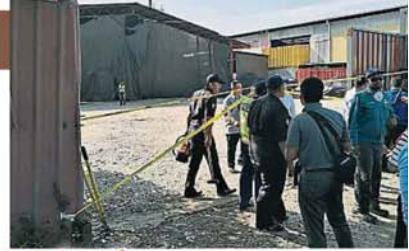
市议会取缔有关非法洋垃圾厂后，就会立即查封有关工厂，不得再运作。