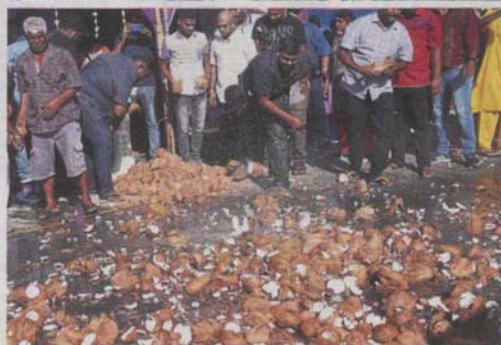
Devotees breaking coconuts during the chariot procession from Jalan Tun HS Lee all the way to Batu Caves.