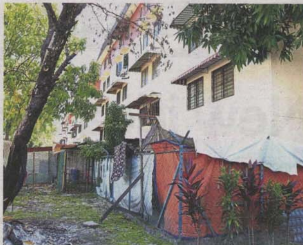
Several ground floor residents at the low-cost flats have illegally extended their homes for more space. Each two-bedroom, one-bathroom unit is less than 500 sq ft.

Programme will see low-cost flat owners get larger replacement units at no extra cost