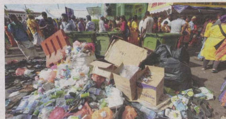
LONGGOKAN sampah yang dibuang berhampiran tong-tong sampah yang disediakan oleh MPS di tapak festival Thaipusam.

Namun di sebalik kemeriahan yang mewarnai perpaduan masyarakat negara ini, sambu-