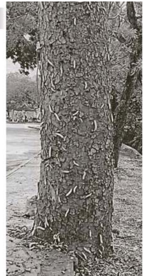
青绿色的毛毛虫成了“不速之客”,似乎把树干当成自己的家,令人不敢趋近。