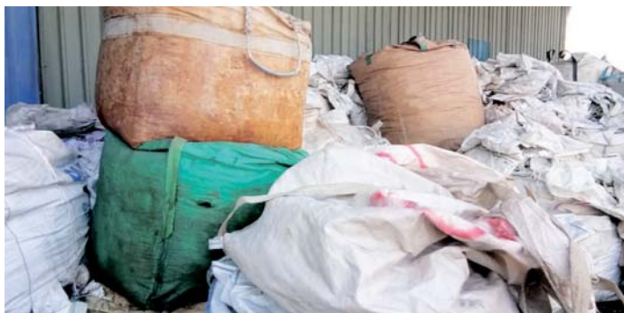
Sisa yang ditemui di kilang plastik haram.