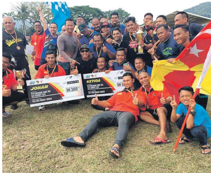
Pasukan tarik tali MBSA A dan B meraikan kemenangan mereka.

Menurutnya, di peringkat separuh akhir kumpulan MBSA A menang ke atas pasukan MBIP (Johor),