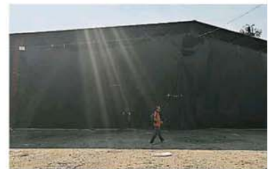
业者利用大块黑布屏蔽大厂，使得外人无法从外头窥看厂内运作。

(巴生23日讯)雪州行政议员黄思汉今日率大队到巴生直落昂展开非法洋垃圾厂取缔行动，并严厉警告业者若一再冥顽不灵重操旧业或不清理有关地段，州政府将毫不犹豫充公该地段！