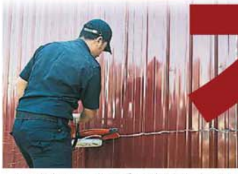
由于无法打开大门，执法人员只好出动电锯，锯开大门。